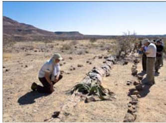
Twyfelfontein, donde vimos el bosque petrificado, la famosa Welwitschia mirabilis (foto superior), y los “Organ Pipes” (foto inferior)