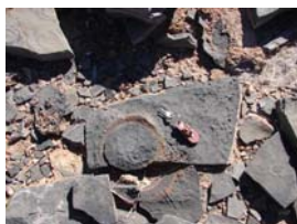
Fish River Canyon (el 2º cañón más grande del mundo) donde en la caliza NAMA encontramos fauna Ediacarensis, y yendo hacia el área del Kalahari vimos in situ el famoso fósil de Messosauuro y tuvimos un animado encuentro con una familia de bosquimanos