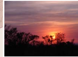
Mpumalanga (lugar del Sol amaneciendo). Safari fotográfico por el P.N. Kruger