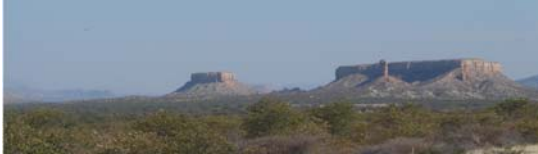
Waterberg Plateau Park con el Vingerklip (dedo de piedra)