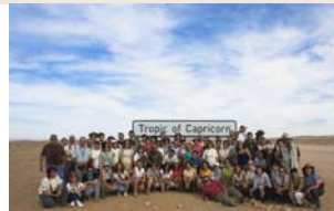
Momentos memorables: Cabo de Buena Esperanza y “rónico de Capricornio” (arriba) Nocturnidad y alevosía (abajo)