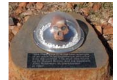
Intimamos con Mrs Ples, una australopitaca de rompe y rasga en Sterkfontein