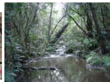
En el Parque de Tsisikamma (aguas cristalinas) y mirando al Indico