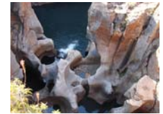
Blyde river canyon