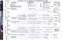
Síntesis de la geología observada en RSA